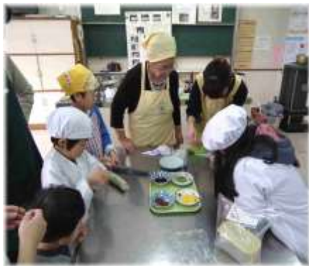
↑ 「やしょうまづくり」

11月15日(日)は、いずみまつりでした。前日から天気が悪く、午前中の「名人講座」では外での活動が中止になり、午後の「おまつりひろば」も体育館で行うなど、予定変更が相次ぎましたが皆様の御協力により、無事に終わることが出来ました。